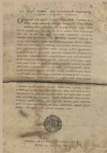
Указ Петра Первого 1714 г.